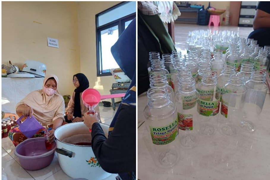
Gambar 2. Proses Pengemasan Teh Rosella

minuman tetap terjaga kualitas kesegaran produk, karena kemasan botol juga dapat membantu suhu internal kemasan tetap sama, sehingga produk tidak rusak. Daya tarik tampilan kemasan botol telah dan akan selalu dianggap sebagai kualitas premium. Umur simpan botol umumnya bertahan dalam periode yang cukup lama dan warnanya tidak memudar. Kemasan botol yang transparan dapat memperlihatkan isi produk dalam kemasan.