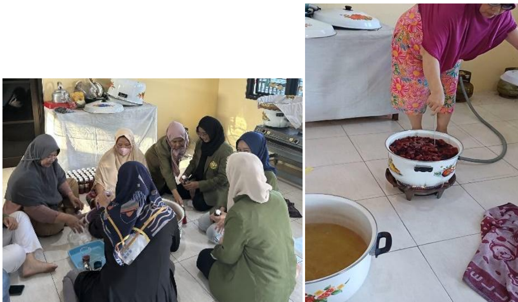
Gambar 1. Proses Produksi Teh Rosella

Tim bina desa melakukan kegiatan praktik produksi teh rosella secara langsung pada 21 Agustus 2023 di Kantor Kelurahan Ngipik bersama 8 anggota ibu-ibu PKK. Teh rosella dipilih untuk pengabdian ini karena proses produksi yang murah, cepat, dan mudah dibuat oleh masyarakat serta banyak manfaatnya untuk kesehatan. Pada kegiatan yang dilakukan yaitu pembuatan minuman teh yang dimulai dengan cara penyiapan bunga rosella yang dikeringkan terlebih dahulu dengan cara penjemuran dibawah sinar matahari sampai kering, kemudian penimbangan bunga rosella, serta memanaskan air didalam panci hingga mendidih serta tidak lupa dicampuri gula, lalu masukkan bunga rosella ke dalam panci, selanjutnya dilakukan tahap menunggu hingga rosella larut dan berubah warna menjadi kemerahan hingga mendidih. Kemudian teh yang telah dibuat dilakukan proses pendinginan sebelum dikemas di dalam botol agar teh tidak cepat basi. Teh rosella ini bertahan 3 hari di suhu ruang dan 1 bulan di alat pendinginan atau kulkas. Teh yang sudah siap kemas akan dimasukkan ke dalam botol.