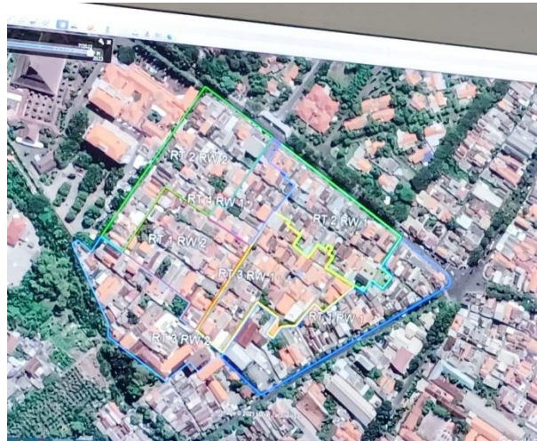
Gambar 5. Peta Kelurahan Ngipik, Gresik

Kelurahan Ngipik merupakan suatu wilayah yang berada di Kecamatan Gresik, Kabupaten Gresik, Provinsi Jawa Timur, Indonesia, dengan luas wilayah 65 Hektar. Jumlah Rukun Warga (RW) pada Kelurahan Ngipik sebanyak 2 yaitu RW 001 dan RW 002 dan dengan jumlah Rukun Tetangga (RT) sebanyak 7 RT.