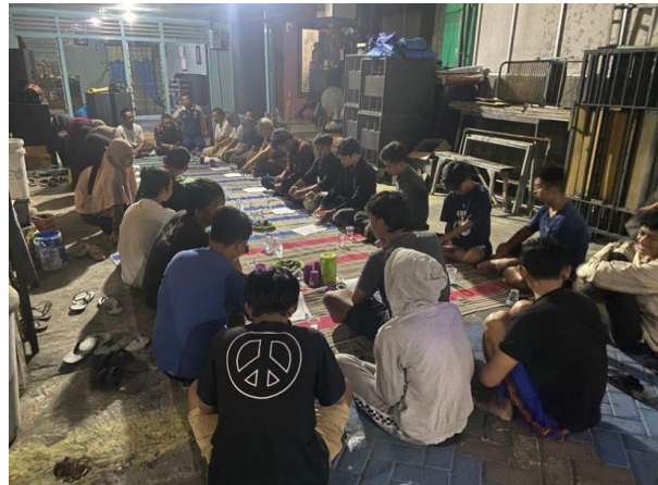
Gambar 1. Diskusi Program Sadar Wisata

lingkungan. Peningkatan yang ditujukan untuk dalam jumlah antusias tinggi yang terlibat dalam proyek-proyek lingkungan wisata dan kegiatan budaya Kelurahan Tlogopatut.