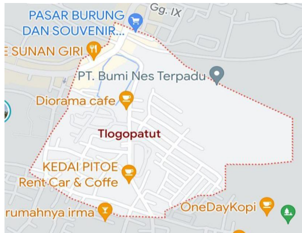
Gambar 3. Peta Kelurahan Tlogopatut, Gresik

Kelurahan Tlogopatut merupakan suatu wilayah yang berada di Kecamatan Gresik, Kabupaten Gresik, Provinsi Jawa Timur, Indonesia, dengan luas wilayah 80 Hektar. Jumlah Rukun Warga (RW) pada Kelurahan Tlogopatut sebanyak 4 dengan jumlah Rukun Tetangga (RT) sebanyak 12 RT.