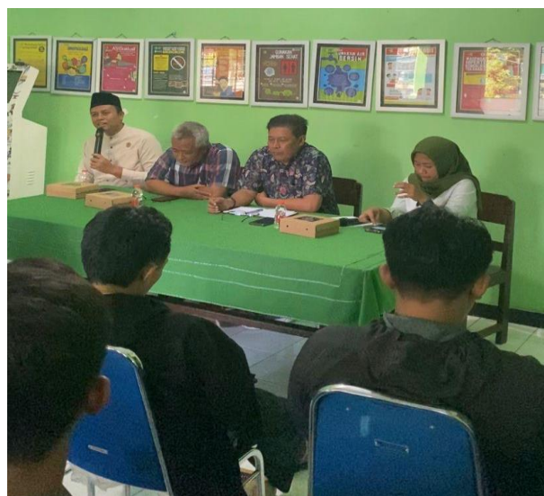
Gambar 2. Sosialisasi Program Sadar Wisata

Kelompok KKN Bina Desa Kelompok 3 berdiskusi dengan membicarakan meningkatkan pemahaman dan kesadaran Program Wisata untuk Masyarakat Tlogopatut. Dalam kegiatan pengabdian kepada masyarakat ini, kelompok KKN Bina Desa memberikan saran untuk pemanfaatan lahan kosong tersebut menjadi tempat berkumpulnya warga Tlogopatut. Kami memberikan saran membangun Pujasara atau Tempat berjualan makanan yang tentunya akan berdampak positif kepada pelaku UMKM Kuliner di Kelurahan Tlogopatut dan mempererat hubungan Masyarakat Tlogopatut melalui tempat pujasara yang rencananya akan dibangun dan masih menunggu kesepakatan bersama. Dampak positif dari kegiatan ini adalah peningkatan pemahaman dan kesadaran masyarakat akan pentingnya pengelolaan lahan yang kecilpun bisa dijadikan tempat wisata masyarakat lokal.