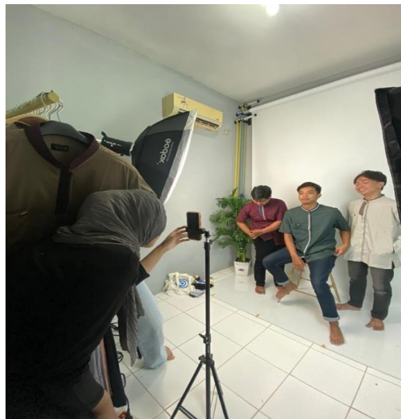
Gambar 2. Pembuatan konten media sosial Bonassa Collection

Kelompok KKN Bina Desa Kelompok 3 membantu membuat akun e – commerce untuk Bonassa Collection dan berdiskusi dengan pemilik usaha membicarakan permasalahan dalam menjalankan pemasaran produknya. Dalam kegiatan pengabdian kepada masyarakat ini, kelompok KKN Bina Desa memberikan saran untuk pemanfaatan media sosial yang ada saat ini untuk meningkatkan pemasaran produknya. Kami juga membuatkan akun Instagram dan juga akun tiktok Bonassa Collection sebagai media promosi produk yang dipasarkan. Dampak positif dari kegiatan ini adalah peningkatan pemahaman dan kesadaran pemilik usaha akan pentingnya penggunaan media sosial sebagai sarana untuk memasarkan produk dengan jangkauan konsumen yang lebih luas