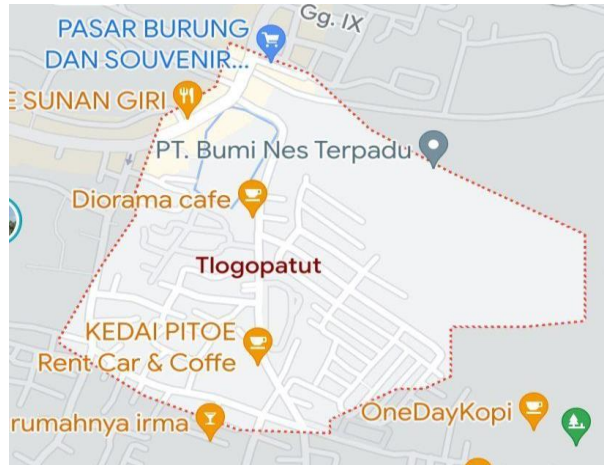
Gambar 3. Peta Kelurahan Tlogopatut, Gresik

Kelurahan Tlogopatut merupakan suatu wilayah yang berada di Kecamatan Gresik, Kabupaten Gresik, Provinsi Jawa Timur, Indonesia, dengan luas wilayah 80 Hektar. Jumlah Rukun Warga (RW) pada Kelurahan Tlogopatut sebanyak 4 dengan jumlah Rukun Tetangga (RT) sebanyak 12 RT.