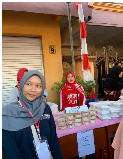
Gambar 1. Bazar UMKM Kelurahan Ngipik

Sinergi dan peran serta masyarakat dalam pembangunan ekonomi merupakan perwujudan dari demokrasi ekonomi. Strategi peningkatan sinergi dan partisipasi masyarakat dilakukan dengan pendekatan peningkatan partisipasi masyarakat dalam perencanaan, pelaksanaan dan evaluasi pembangunan KUMKM; peningkatan kapasitas institusi pembina dan dunia usaha untuk berpartisipasi dalam pembangunan KUMKM; dan pengembangan kelembagaan UMKM.