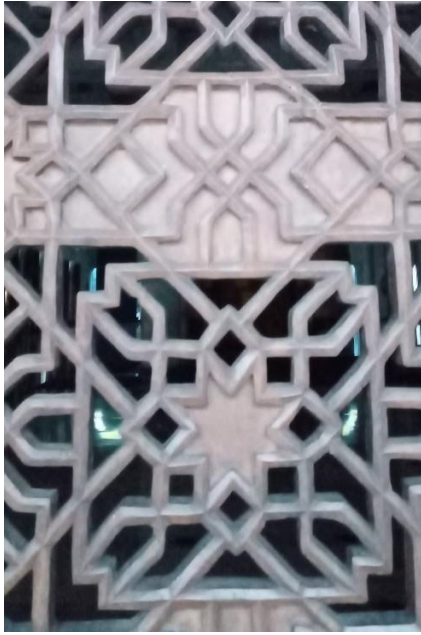
Gambar-3. Panel Decoratif Buka-an Jendela Masjid Al-Akbar, Surabaya

Secara umum, kondisi ini hampir sama dengan bentuk ornamen interior masjid jaman dahulu. Dimana bentuk ukiran dan kaligrafi banyak sekali menjadi penghias masjid-masjid besar di tanah air. Beberapa bagian yang umumnya dihiasi dengan ukiran dan kaligrafi adalah pintu, hiasan dinding di atas yang sering di ukir dengan kaligrafi, podium, dan beberapa elemen yang sering kali menghiasi masjid- masjid tempo dulu.