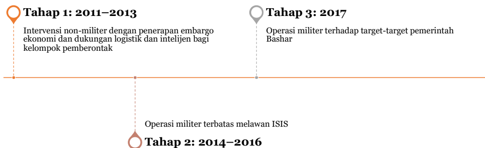
Gambar 2. Intervensi Amerika Serikat dalam Perang Sipil Suriah

Untuk menjelaskan intervensi Amerika Serikat dalam perang sipil Suriah, maka perlu didefinisikan terlebih dahulu mengenai jenis intervensi yang dijalankan oleh Amerika Serikat. Keterlibatan Amerika Serikat dalam perang sipil Suriah pada dasarnya terbagi menjadi dua, yaitu intervensi non-militer dan intervensi militer. Namun, dalam periode diantara kedua jenis intervensi tersebut terdapat satu klasifikasi yang masuk ke wilayah abu-abu dimana Amerika Serikat menggunakan instrumen militer namun tidak menasar target rezim Bashar secara langsung. Secara sederhana, intervensi tersebut dapat digambarkan sebagai berikut: