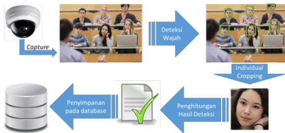
Gambar 1. Alur sistem

Pada Gambar 1 terlihat ada 2 proses utama. Proses 1 adalah pengenalan wajah itu sendiri. Proses 2 adalah sistem otomatis mengirim pesan ke nomor telegram orang tua mahasiswa.