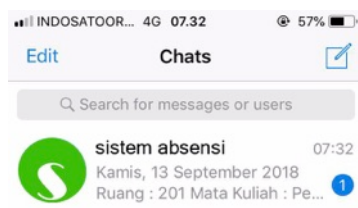
Gambar 4. Pesan Terkirim ke Telegram

Gambar 4 terlihat bahwa pesan terkirim ke telegram orang tua.