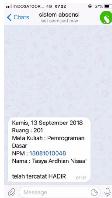
Gambar 5. Isi Pesan di Telegram

Gambar 5 menampilkan pesan terkirim ke nomor telegram orang tua mahasiswa lengkap beserta nama, mata kuliah serta jam mata kuliah itu berlangsung.