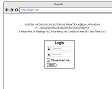
Gambar 5. Desain User Interface

Perancangan user interface terdiri dari perancangan halaman-halaman yang terlihat oleh pengguna/pengunjung. Perancangan user interface terdiri dari perancangan halaman depan, halaman admin, dan halaman pembimbing lapangan. Perancangan user interface meliputi perancangan layout , navigasi, warna, dan typeface . Perancangan user interface digambarkan sebagai berikut: