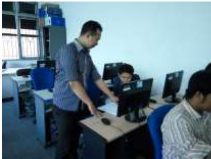
Gambar 3. kegiatan pengenalan Jendela Coreldraw.

Berikut beberapa gambar yang menunjukkan kegiatan pengenalan Jendela Coreldraw.