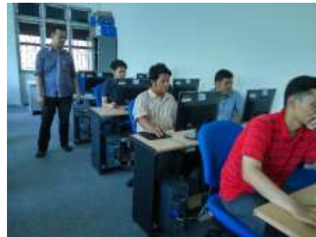
Gambar 5. kegiatan Evaluasi.

pondok pesantren. Berikut beberapa gambar yang menunjukkan kegiatan Evaluasi.