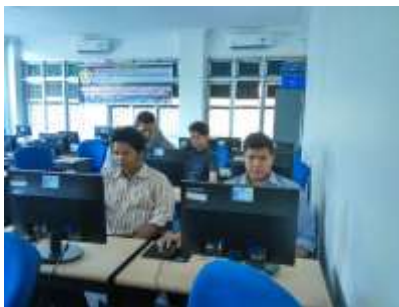
Gambar 4. kegiatan pengenalan Obyek Grafis.

Berikut beberapa gambar yang menunjukkan kegiatan pengenalan Obyek Grafis.