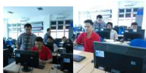
Gambar 2. kegiatan pengenalan.

Merupakan program aplikasi desain grafis intuitif dan menyediakan banyak fasilitas yang menawarkan kemudahan bagi pengguna dalam membuat sebuah obyek desain grafis. Berikut beberapa gambar yang menunjukkan kegiatan pengenalan.