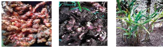
Gambar 1. Tanaman jahe merah.

atsiri 15–35% , semakin tinggi kadar oleoresin maka rasanya semakin pedas (Stoilova et. al, 2007).