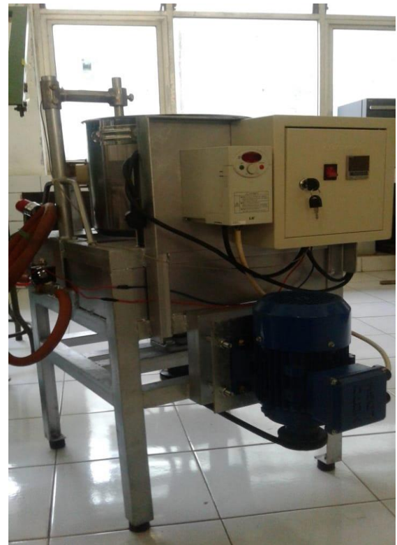
Gambar 4. Kristalizer putar

Mula-mula jahe merah yang sudah ditambah air dihancurkan dan diperas, penambahan air dengan perbandingan 1:1-1:1,5 kemudian diuapkan dalam evaporator vacum pada tekanan yang bervariasi dari 380-760 mmHg dan distilat ditampung sama dengan jumlah air yang ditambahkan pada perbandingan 1:1 yaitu sebanyak 2200 cc. Ekstrak dikeluarkan dari evaporator kemudian dipindahkan dalam alat kristalisasi putar dan ditambah gula secukupnya untuk dikeringkan hingga membentuk kristal. Proses kristalisasi dilakukan pada kecepatan dan suhu tertentu hingga diperoleh jumlah kristal maksimum.