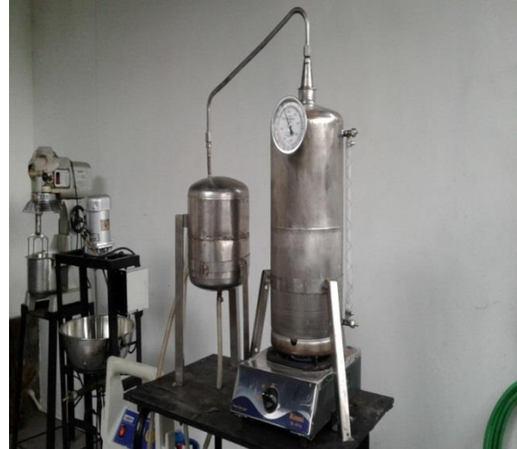
Gambar 3. Vacum Evaporator

Rangkaian alat percobaan untuk proses evaporasi menggunakan pompa vacum yang terdiri dari tangki evaporator beserta pemanasnya, condensor dan pompa vacum sebagai berikut .