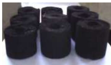
Gambar 1. Spesifikasi produk briket.

Hasil proses pembuatan briket arang dari bambu menggunakan alat pencetak hidrolik dengan dimensi berbentuk silinder berlubang, Diameter dalam (Di) 2 cm, Diameter luar (Do) 5 cm dan Tinggi 10 cm. Hasil yang didapat dapat ditunjukkan sebagaimana Gambar 1.