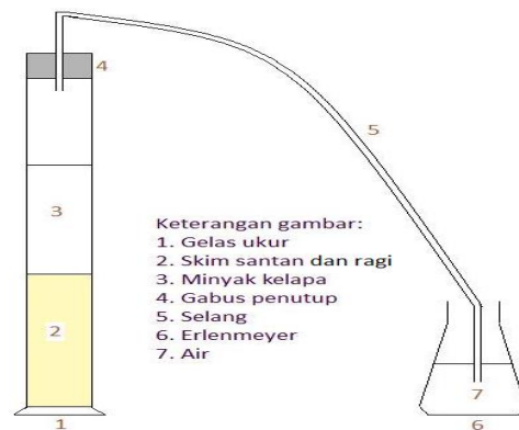
Gambar 2. Skema proses fermentasi skim santan kelapa.