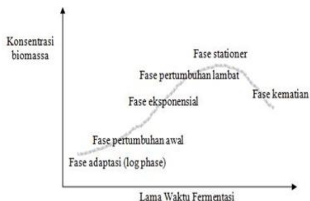
Gambar 1. Kurva pertumbuhan mikroorganisme terhadap konsentrasi biomas (Fardiaz, 1992).

Dalam proses fermentasi selalu melibatkan katalis enzim. Enzim adalah katalisator atau biokatalisator yang dihasilkan oleh mikroorganisme dan dapat mempercepat terjadinya reaksi kimia. Pertumbuhan mikroorganisme yang dibutuhkan pada medium tertentu memiliki kurva seperti yang ditunjukkan pada gambar di bawah ini.