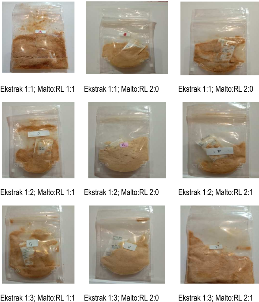
Gambar 3. Perbedaan warna dari semua perlakuan penelitian

Pada Tabel 3 menunjukkan bahwa derajat putih minuman fungsional berkisar 65.96 - 78.92. Pada proporsi buah mengkudu dengan air (1:1) dan proporsi maltodekstrin pati kimpul dengan rumput laut (1:1) menghasilkan nilai derajat putih paling rendah yaitu 65.96, sedangkan perlakuan proporsi buah mengkudu dengan air (1:3) dengan proporsi maltodekstrin pati kimpul dengan rumput laut (2:0) menghasilkan nilai derajat kecerahan