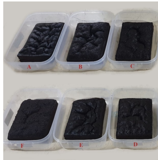
Gambar 1. Produk Brownies Tepung Terigu : Tepung Beras Ungu Dengan Enam Perlakuan

Dikocok telur 1 butir dengan gula halus 45 g hingga berbusa. Dimasukkan coklat dan mentega yang telah dilelehkan perlahan-lahan bersamaan dengan susu cair 34 g. Dicampur sampai homogen. Kemudian ditambahkan campuran tepung terigu dan tepung beras ungu dengan total perbandingan 34 g sedikit demi sedikit. Diaduk hingga rata. Dituang adonan ke dalam loyang berukuran 15 x 10 x 4 cm (p x l x t cm). Sebelumnya olesi dulu loyang dengan margarin. Dikukus sampai matang selama 20 menit. Produk brownies kukus substitusi tepung beras ungu dapat diamati pada Gambar 1.