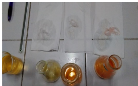
Gambar 2. Hasil penelitian dengan metode benang wol dari kiri merk saus sambal: Delmonte, Tiga Berlian, Ratu